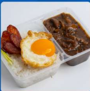
ข้าวหน้าไก่ราชวงศ์ไข่ดาว Signature braised chicken in brown sauce topped with fried egg over rice 135