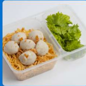
บะหมี่แห้งลูกชิ้นปลา Fish balls with egg noodle 150