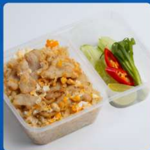
ข้าวผัดหมู / ไก่ Fried rice with pork / chicken 175