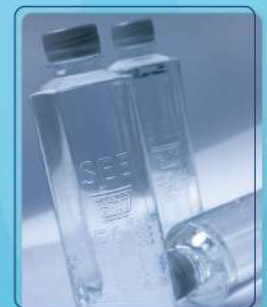
น้ำดื่มขวดสีฟ้า (500ml.) Still water 500 ml.