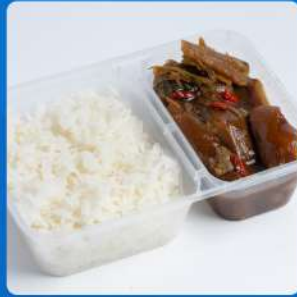
ข้าวอบหมู Baked rice with slow cook pork leg in clay pot 175