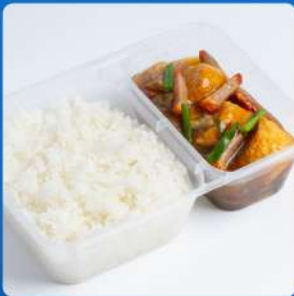
ข้าวอบเต้าหู้หมูแดง Baked rice with tofu and roasted pork in clay pot 175