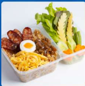
ข้าวผัดน้ำพริกขิงเรือ Chili spiced-dip fried rice with sweet pork, shredded omelette, salted egg and fresh vegetables 205