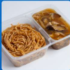
โกยซีหมี่ Baked egg noodle with chicken and bamboo shoot 155