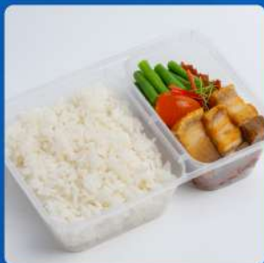
ข้าวผัดพริกหมูกรอบ กั้วผักยาวไข่เค็ม Stir-fried crispy pork with long beans topped with salted egg over rice 175