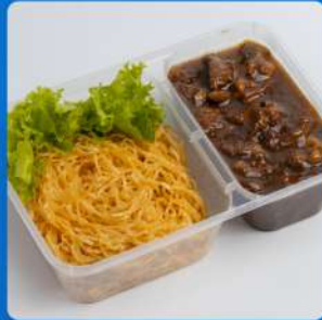
บะหมี่แห้งหน้าไก่ราชวงศ์ Signature braised chicken in brown sauce with egg noodle 130