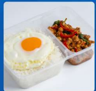
ข้าวกะเพราหมูสับ / ไก่สับ ไข่ดาว Stir-fried Thai basil with minced pork / minced chicken topped with fried egg over rice 155