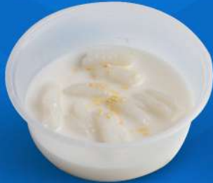
ครองแครงกะทิ Thai gnocchi in coconut milk