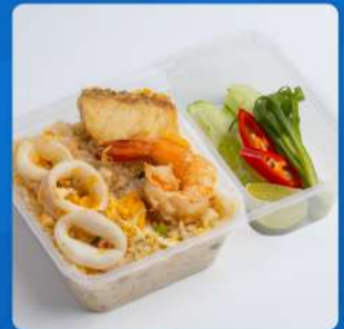
ข้าวผัดรวมมิตรทะเล Seafood fried rice 210