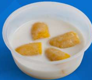
กล้วยบวชชี Banana in sweet coconut cream