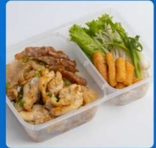
ก๋วยเตี๋ยวลูกชิ้นไก่ Aroma charred rice noodle with chicken 150