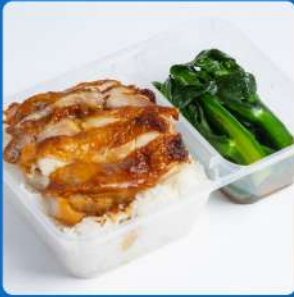
ข้าวอบไก่สีฟ้า SEE FAH signature baked chicken rice in clay pot 175

ราคา Classic Meal Box เป็นเพียงราคาอาหารที่ไม่รวม เครื่องดื่ม และขนม