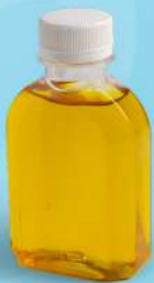
น้ำเก็กฮวย (150ml.) Thai gnocchi in coconut milk 35