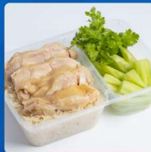
ข้าวมันไก่ตอน Rice steamed with chicken 135