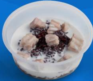
ข้าวเหนียวดำเปียกเผือก Black sticky rice with sweet coconut cream