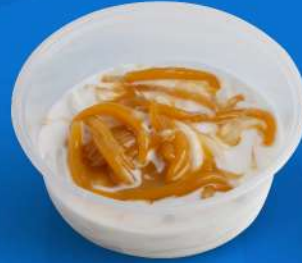
ปลากริมไข่เต่า Vermicelli in coconut Milk