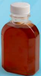
น้ำชามะนาวน้ำผึ้ง (150ml.) Thai gnocchi in coconut milk 45