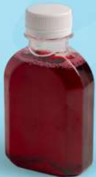
น้ำกระเจียบ (150ml.) Thai gnocchi in coconut milk 35

เครื่องดื่ม มีค่าใช้จ่ายเพิ่มเติม จาก Deluxe Set Box