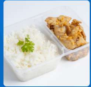
ข้าวอบไก่ / หมูกระเทียมพริกไทย Baked rice with garlic chicken / pork in clay pot 175