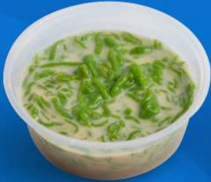
ลอดช่องน้ำกะทิ Thai cendol with palm sugar syrup

เครื่องดื่ม และขนมมีค่าใช้จ่ายเพิ่มเติมจาก Classic Meal Box