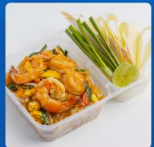
ผัดไทยกุ้งสด Pad Thai with shrimps 210