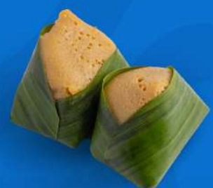
ข้าวเหนียวสังขยา Sweet sticky rice with Thai custard