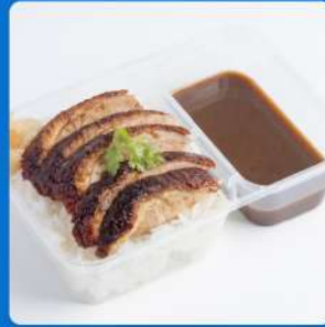
ข้าวหน้าเป็ดย่างสีฟ้า Roasted duck over rice 175