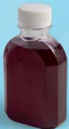
น้ำอัญชัญมะนาว (150ml.) Thai gnocchi in coconut milk 45