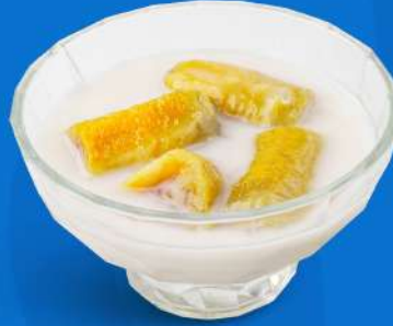
กล้วยบวชชี Banana in sweet coconut cream