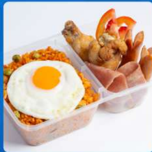
ข้าวผัดอเมริกัน American fried rice 185