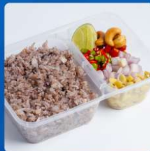
ข้าวอบหน้าลิ้น Baked rice with minced pork and Chinese black olive in clay pot 165