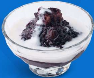
ข้าวเหนียวดำเปียกเฟือก Black sticky rice with sweet coconut cream