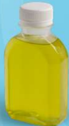
น้ำตะไคร้ (150ml.) Thai gnocchi in coconut milk 35