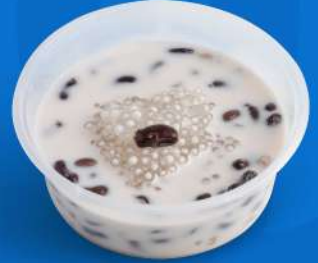
สากุ๊วดำ Sago & black bean in coconut milk