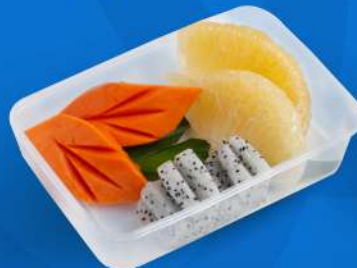
ผลไม้รวม (ตามฤดูกาล) Seasonal mixed fruit