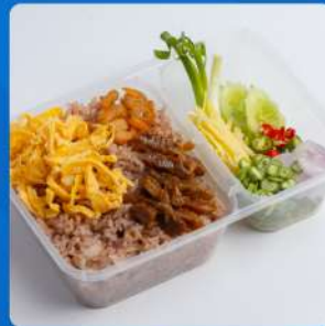
ข้าวคลุกกะปิ Shrimp paste fried rice with sweet pork and fresh vegetables 185