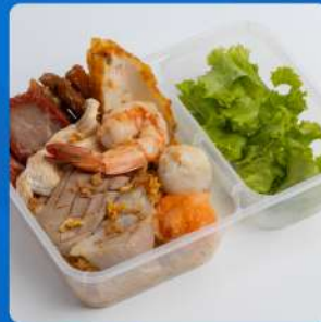
บะหมี่แห้งอัครวิณ Signature assorted toppings on egg noodle 185