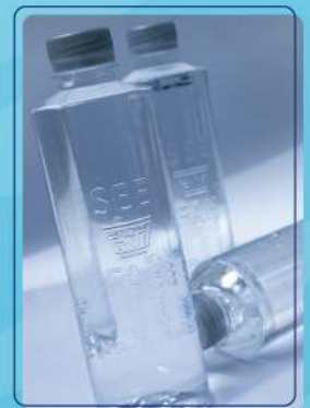
น้ำดื่มขวดสีฟ้า (500ml.) Still water 500 ml. 25