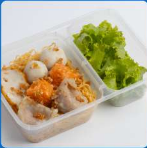
บะหมี่แห้งราชวงศ์ Signature assorted fish balls on egg noodle 130

ราคา Classic Meal Box เป็นเพียงราคาอาหารที่ไม่รวม เครื่องดื่ม และขนม