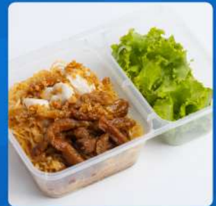
บะหมี่แห้งปูหมูหวาน Crab meat and sweet pork with egg noodle 250