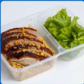
บะหมี่แห้งเป็ดย่างสีฟ้า Roasted duck with egg noodle 155