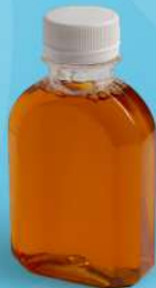
น้ำมะตูม (150ml.) Thai gnocchi in coconut milk 35