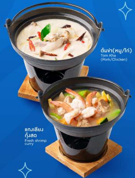
ต้มท่า (หมู/ไก่) Tom Kha (Pork/Chicken)