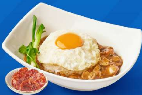
ข้าวหน้าไก่ราชมงคลไข่ดาว Signature braised chicken in brown sauce topped with fried egg over rice

กรณีสั่งเครื่องดื่ม น้ำแข็ง แอมป์ฟรีในแพคเกจ