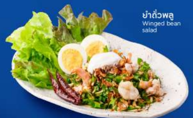
ยำถั่วพูลู Winged bean salad