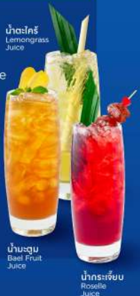
น้ำมะตูม Bael Fruit Juice

*น้ำเปล่า/น้ำแข็ง แคมฟรีในแพคเกจ Free water/ice included in the package