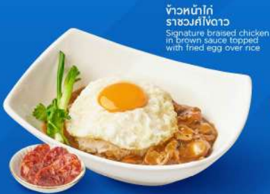
ข้าวหน้าไก่ ราชมงคิโงดาว Signature braised chicken in brown sauce topped with fried egg over rice