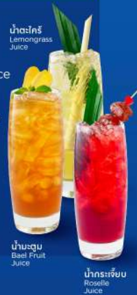
น้ำมะตูม Bael Fruit Juice

*น้ำเปล่า/น้ำแข็ง แคมฟรีในแพคเกจ Free water/ice included in the package