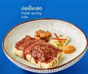
โปะเป็ยะสด Fresh spring rolls