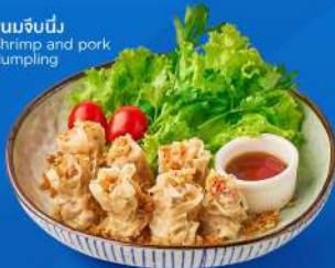
นมจืด Shrimp and pork dumpling