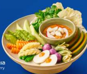
หลนไข่ปูทะเล Crab Roe Curry