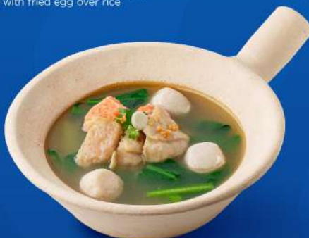
เกี๊ยวปลาหน้าราชมงคล Assorted fish and shrimp balls soup