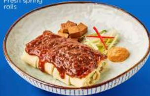
ปอเปี๊ยะสด Fresh spring rolls