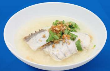
ข้าวต้มปลากระพงทรงเครื่องสีฟ้า SEEFah Sea Bass Porridge