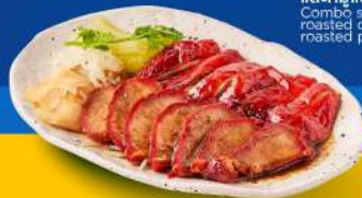
เปิดย่าง และหมูแดง Combo signature roasted duck and roasted pork