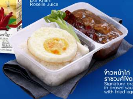
ข้าวหน้าไก่ ราชมังคัลไมตรี Signature braised chicken in brown sauce topped with fried egg over rice