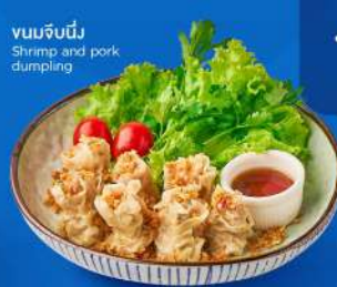
นมจืดนึ่ง Shrimp and pork dumpling