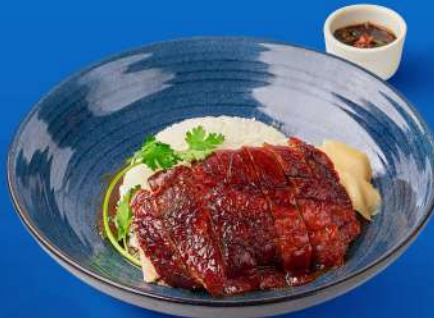
ข้าวหน้าเป็ดย่างสีฟ้า SEEFah Roasted Duck Rice