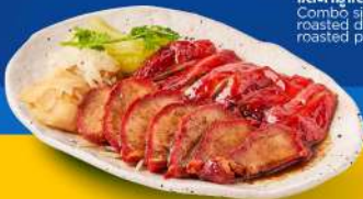
เปิดย่าง และหมูแดง Combo signature roasted duck and roasted pork