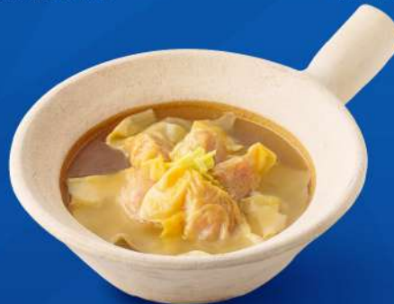
เกี๊ยวกุ้งน้ำ Shrimp Wonton Soup