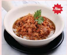
ข้าวอบ (หมู / เนื้อ) กระเทียมพริกไทย Baked garlic (pork / beef) with rice in clay pot