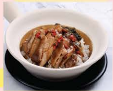
ข้าวอบหมู Slow cook pork leg with rice in clay pot