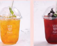
เก็กฮวยสุตส์พีฟา Signature sweet chrysanthemum drink