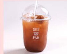
ชาบ๊วย Plum Black Tea