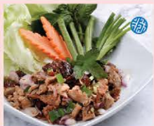
ลาบเป็ดย่างสด Thai spicy roasted duck salad with fresh herbs