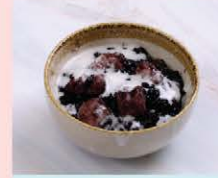
ข้าวเหนียวดำเปียกผ็อก Black sticky rice with sweet coconut cream