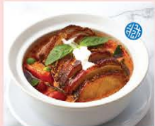
แกงเผ็ดเป็ดข่า Roasted duck in red curry