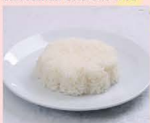
ข้าวหอมมะลิออร์แกนิก Organic jasmine rice