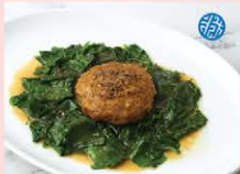
ตำส้มผัดหมูสับ Stir fried ivy gourd leaves with minced pork