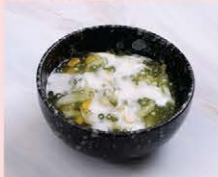
สาเกตุลูกบัว Tapioca pearl with lotus seeds in syrup with a dash of coconut cream