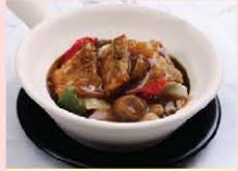
ก๋วยเตี๋ยวราดหน้าปลากระพงเผ็ด Pan fried rice noodle with crispy sea bass and Chinese black bean gravy in clay pot