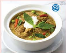
แกงพริกขี้หนูเนื้ออ่อน Tender beef shank curry