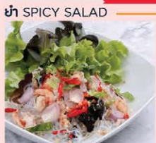
ยำวุ้นเส้น Spicy vermicelli salad with shrimp and pork