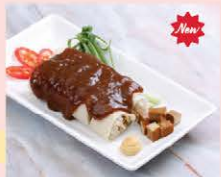
ปอเปี๊ยะสดมังสวิรัติ Vegetarian fresh spring rolls