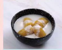
กล้วยบวชชี Banana in sweet coconut cream