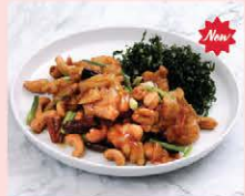
ไก่ผัดพริกแห้งเม็ดมะม่วงหิมพานต์ Stir fried chicken with dry chili and cashew nuts