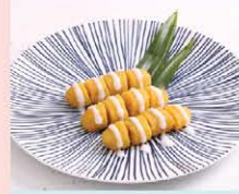
กล้วยไข่เชื่อม Lady finger bananas in syrup