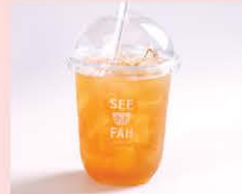
ชาเขียวชอร์รี่ลอสชั่น Green tea cherry blossom