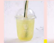
ตะครีสุตส์พีฟา Signature sweet lemongrass drink