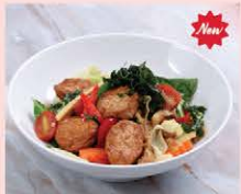
ก๋วยเตี๋ยวผัดที่มาจากมังสวิรัติ Stir fried rice noodle with mixed vegetables, basil and chili