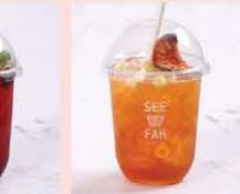
กระเจี๊ยบสุตส์พีฟา Signature sweet roselle drink