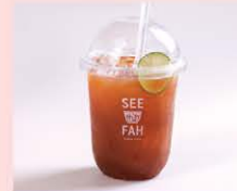
ชามะนาวน้ำผึ้ง Signature honey lemon tea