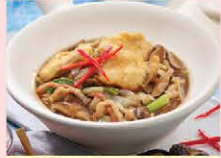
ก๋วยเตี๋ยวราดหน้าปลากระพง Pan fried rice noodle with crispy sea bass and gravy in clay pot