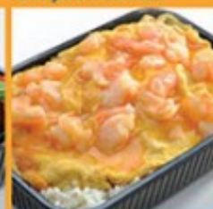
ข้าวไข่ข้นกุ้ง 125 Omelette with shrimp on rice