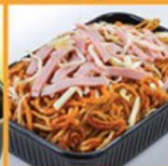
ไข่หมี 145 Baked egg noodle with chicken and ham