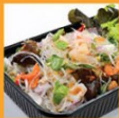
ข้าวเส้นผัด 150 Vermicelli spicy salad