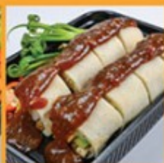
ปอเปี๊ยะสด 80 Chinese fresh spring roll