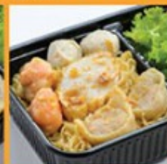
บะหมี่ไข่กุ้งพิเศษ 95 Egg noodle with special assorted fish ball