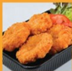
ทอดมันกุ้ง 175 Shrimp cake