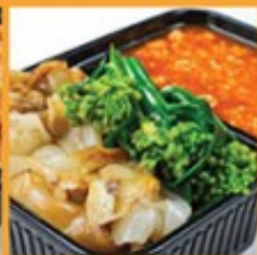
ก๋วยเตี๋ยวราดหน้าหมู/เนื้อดำ 130/135 Rice noodle with minced pork or beef in brown sauce