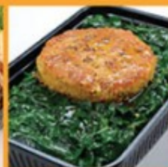
ตำหึงผัดหมูสับ 165 Stir-fried ivy gourd leaves with minced pork