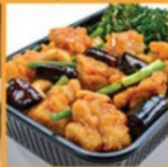
ไก่ผัดพริกแห้งเม็ดมะม่วงหิมพานต์ 160 Stir-fried chicken with cashew nuts