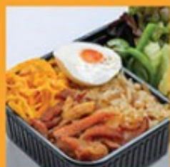
ข้าวผัดน้ำพริกขิงเผ็ด 155 Chili paste fried rice