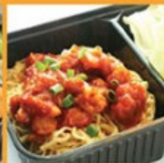
บะหมี่ไข่กุ้งเสฉวนแดง 95 Egg noodle with chicken in Chinese red sauce