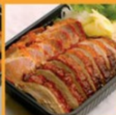
เป็ดย่าง-หมูแดง 175 Roasted duck & roasted pork