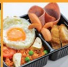
ข้าวผัดอเมริกัน 135 Fried rice with fried chicken, sausage, ham, and fried egg