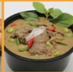
แกงพริกขี้หนูเนื้ออ่อน 230 Beef and chili green curry