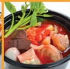
เย็นตาโฟ 95 Yen Ta Fo - Pink noodle soup