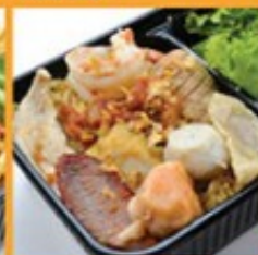
บะหมี่ไข่กุ้งพิเศษ 135 Egg noodle with Seefah special topping