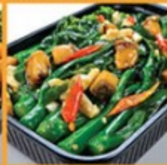
คะน้าฮ่องกงผัดปลาเกลือ 170 Stir-fried Hong Kong kale with salted fish