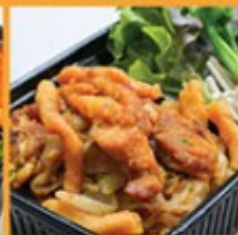
ก๋วยเตี๋ยวตุ๋นไก่ 125 Fried noodle with chicken and egg