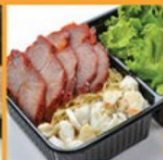
บะหมี่ไข่กุ้ง-หมูแดง/หมูหวาน 160 Crab meat egg noodle with roasted pork or sweet pork