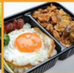
ข้าวหมกไก่ราชมังคผลไข่ดาว 95 Braised chicken with fried egg on rice