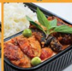
ข้าวแกงผัดเป็ดย่าง 150 Roasted duck red curry with rice