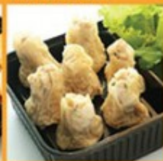
ขนมจีบึ่ง 85 Steamed dumpling