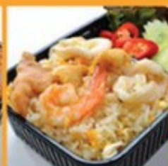
ข้าวผัดรวมมิตรทะเล 165 Seafood fried rice