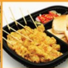
หมูสะเต๊ะ-ขนมปัง 150 Grilled pork Satay with toasted