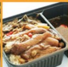
ข้าวอบขาหมู 135 Braised pork leg with rice