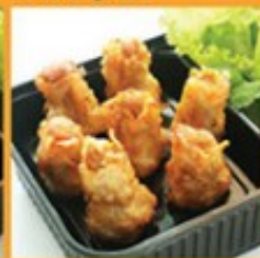
ขนมจีบทอด 90 Deep-fried dumpling