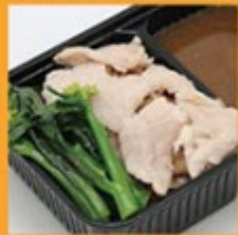
ก๋วยเตี๋ยวราดหน้าหมู/เนื้อ 130/135 Rice noodle with pork or beef in brown sauce