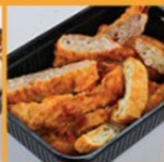
เต้าหู้ ผักโขม ไซเท้าทอด 90 Deep-fried tofu, taro, and white radish