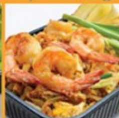
ผัดไทยกุ้งสด 165 Shrimp Pad Thai