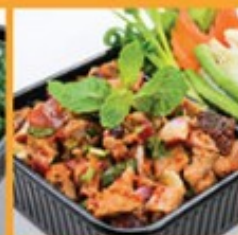
สามเป็ดย่าง 165 Roasted duck spicy salad