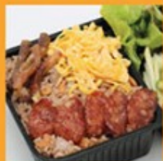
ข้าวตุลุกกะปิ 150 Shrimp paste fried rice with mixed condiments