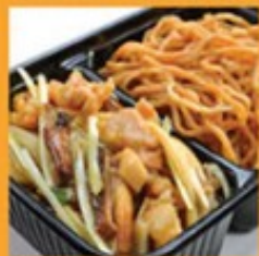
โก๋ยไข่หมี 130 Fried egg noodle with chicken and bamboo shoot