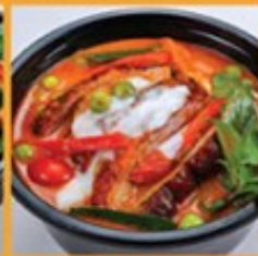
แกงผัดเป็ดย่าง 230 Roasted duck red curry