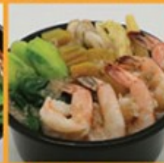
แกงเนียงกุ้งสด 270 Spicy mixed vegetables soup with shrimp