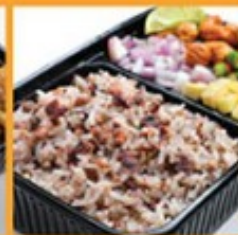
ข้าวอบหน้าเนียง 125 Baked black olive and pork with rice