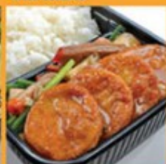
ข้าวอบเต้าหู้หมูแดง 125 Bake roasted pork and tofu with rice